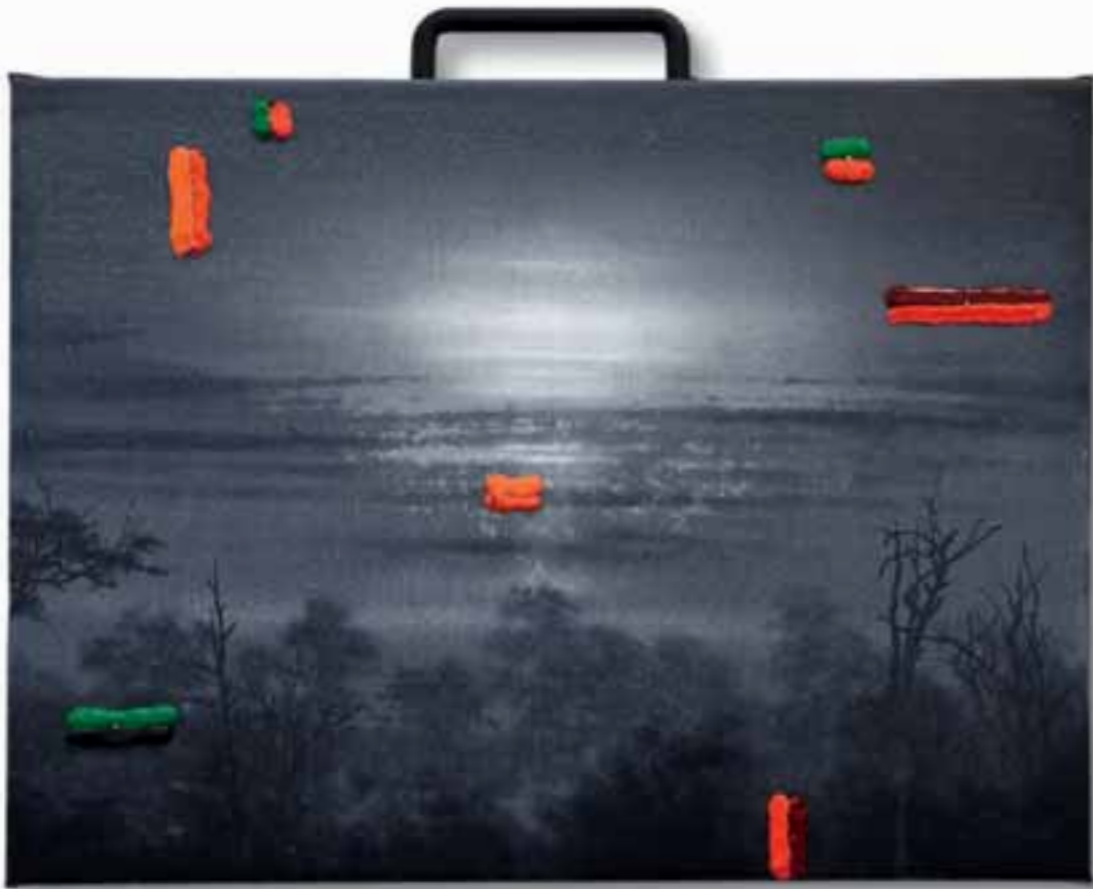
| Tsar 2013 tecnica mista su tela 32 x 40 cm |