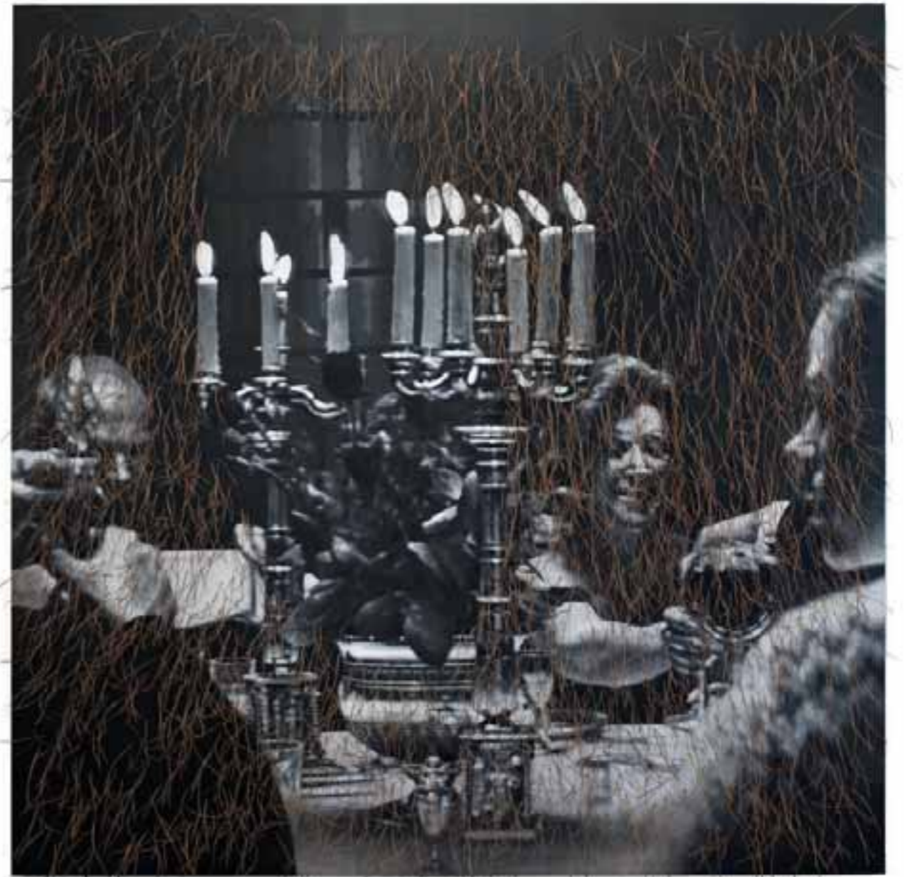
| Brindis furtivo 2012 tecnica mista su tela 200 x 200 cm |