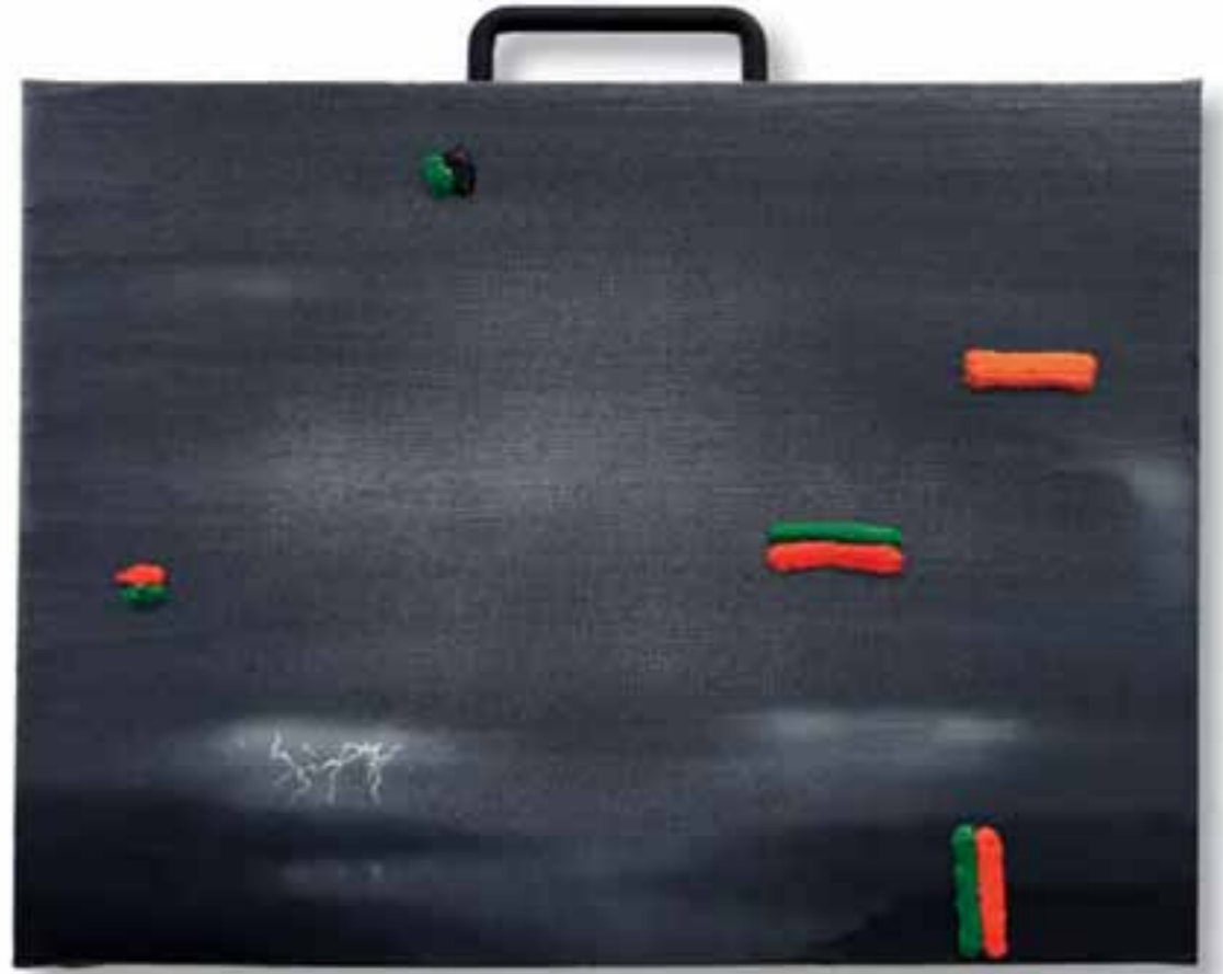
| La danza 2013 tecnica mista su tela 32 x 40 cm |