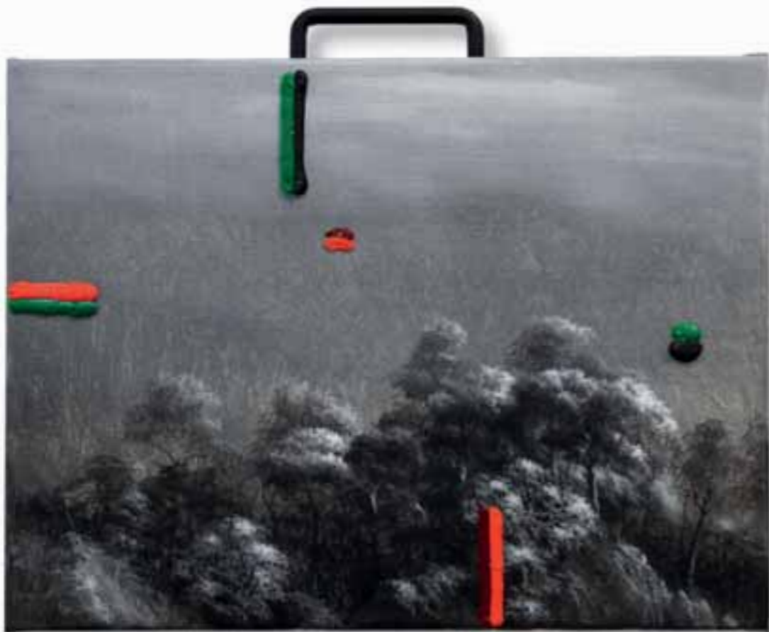
| Siesta 2013 tecnica mista su tela 32 x 40 cm |