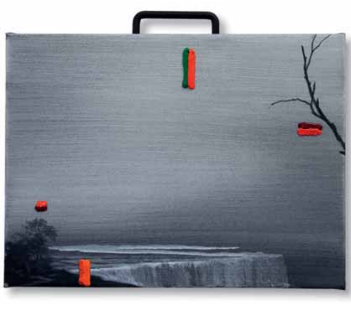
| Cyd Charisse 2013 tecnica mista su tela 32 x 40 cm |