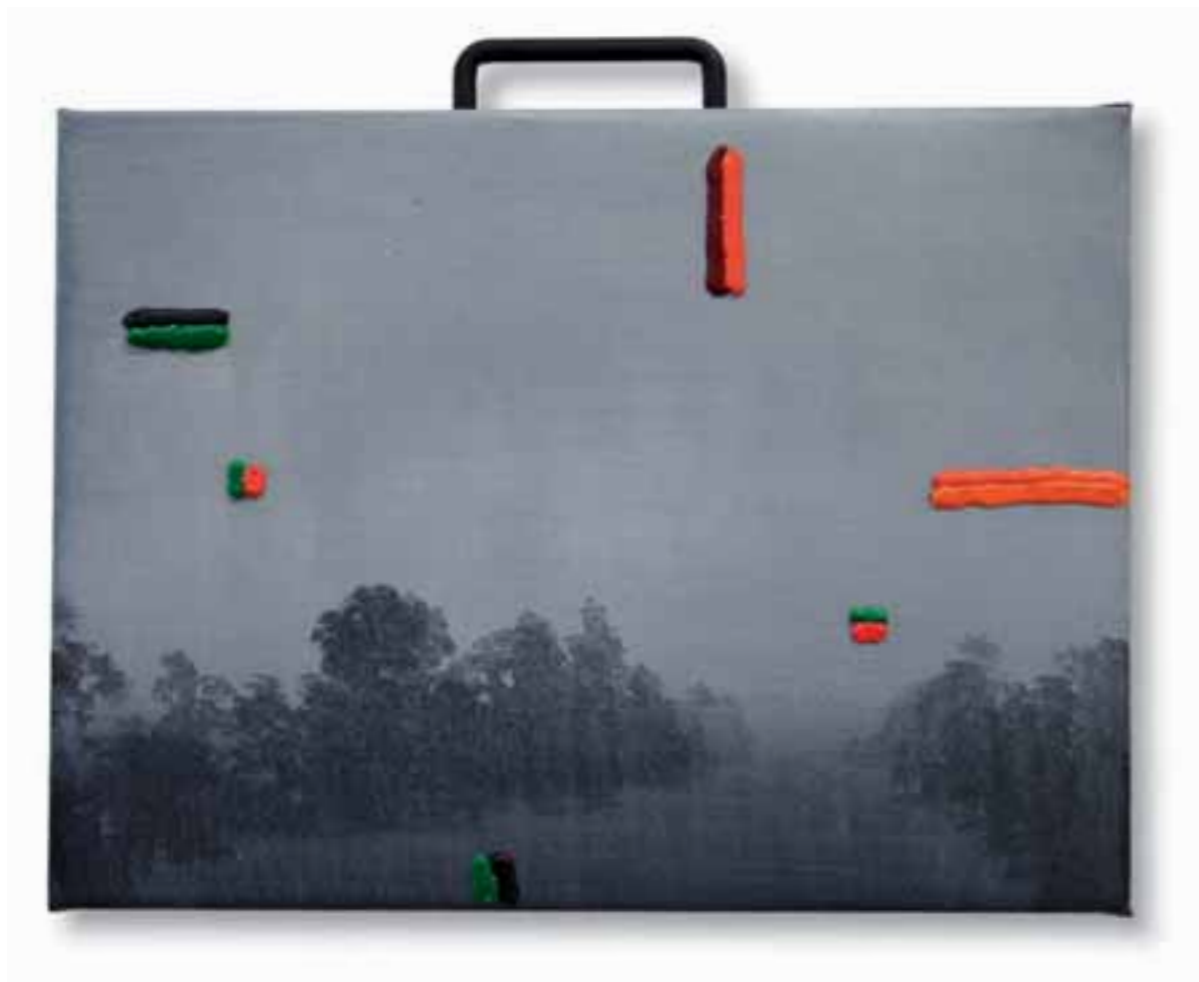
| Monzón 2013 tecnica mista su tela 32 x 40 cm |