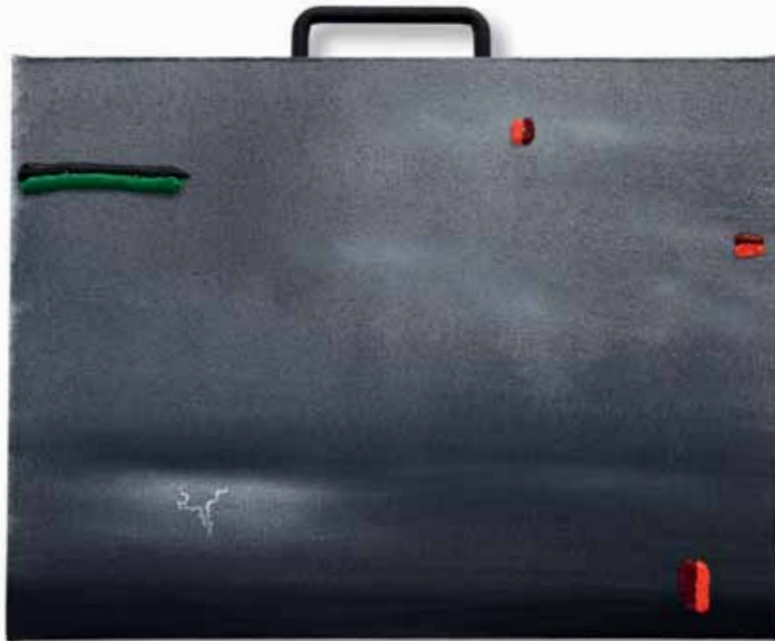
| Romeo y Julieta 2013 tecnica mista su tela 32 x 40 cm |