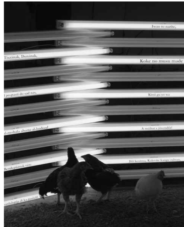
Pipo Hernández, Corral n°2 / Yard n°2 (detalle/ detail) (2009). Tubos fluorescentes, vinilos, nueve gallinas y un gallo / fluorescent tubes, nine chickens, vinyl. Altura / height: 1 m, Ø 4,50 m.

De las lámparas de tubos fluorescentes me seduce no sólo su aspecto de arcaísmo tecnológico; las uso como línea de horizonte cósmico. Apagadas, como objetos sospechosos a la espera, actúan como signifiante de la utopía clausurada.