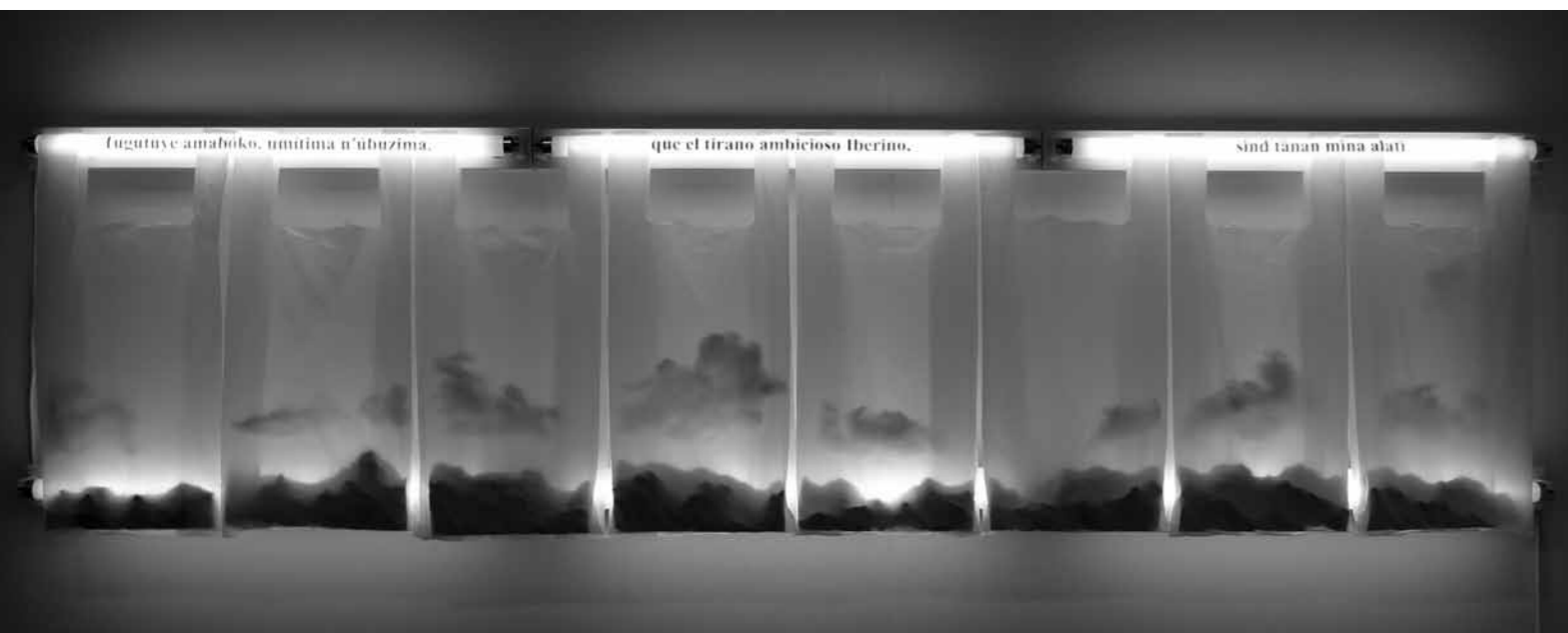
Pipo Hernández, Algún día todo esto será tuyo / Someday All This Will be Yours (2012). Tubos fluorescentes, bolsas de plástico, vinilo, diversos materiales / fluorescent tubes, plastic bags, vinyl, various materials. 240x46 cms.

What attracts me to fluorescent lights isn't only their antiquated technology; I use them as horizontal decorative lines. When turned off, as suspect, waiting objects, they act as signifiers of a cloistered utopia.