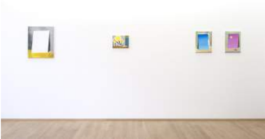
Easy Paintings Exhibition View Nosbaum Reding, Luxembourg, 2018