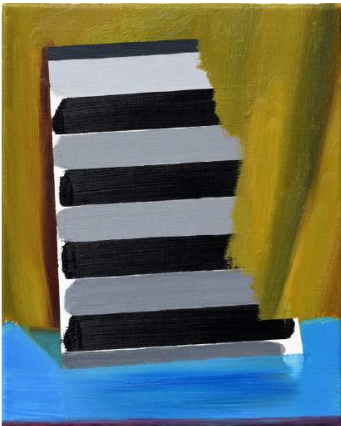
Instrucciones para subir una escalera , 2017