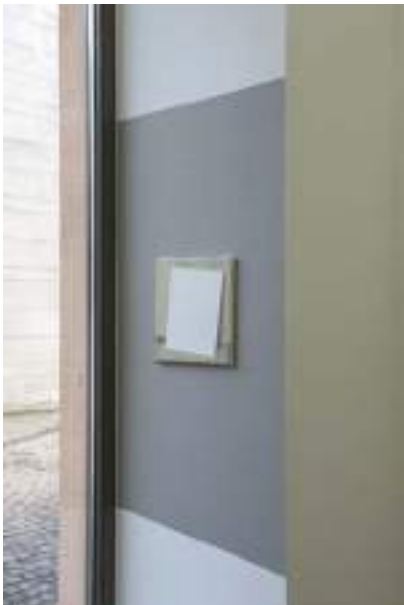
Easy Paintings Exhibition View Nosbaum Reding, Luxembourg, 2018