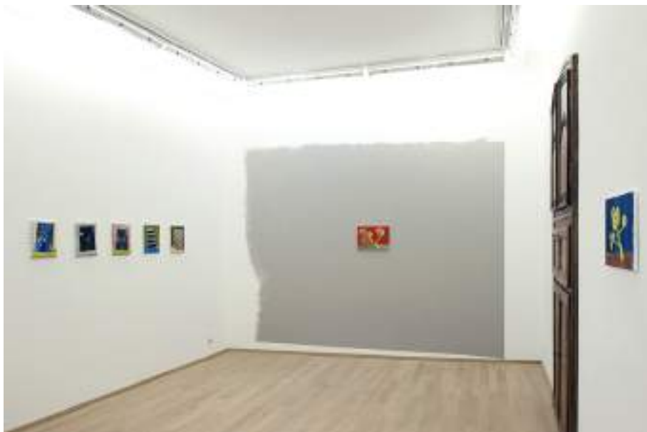
Easy Paintings Exhibition View Nosbaum Reding, Luxembourg, 2018