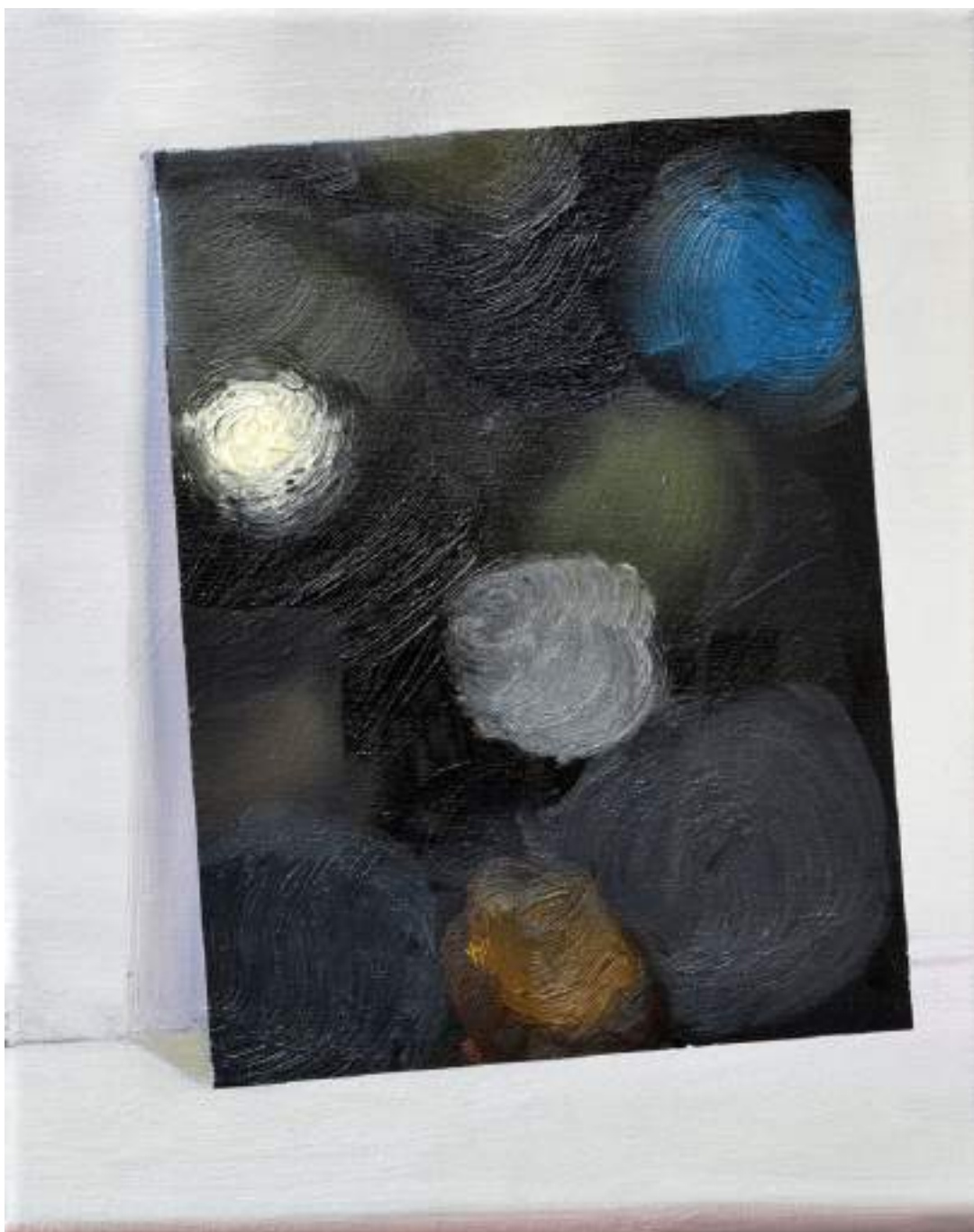
Four reasons to be optimistic (II) , 2017 Oil on canvas 30x24cm