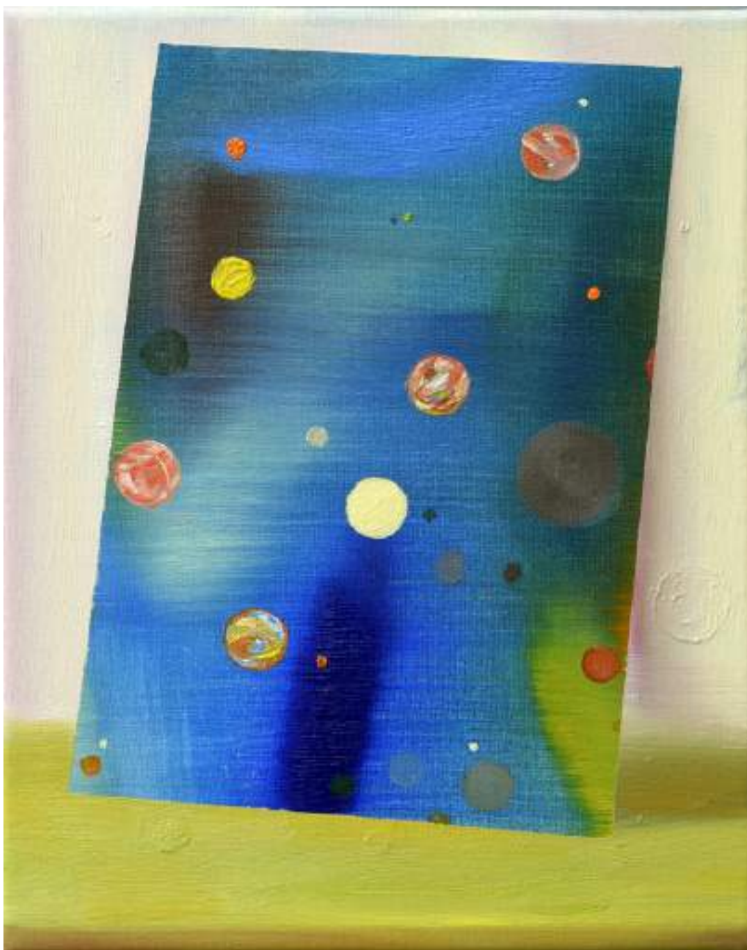
Four reasons to be optimistic (III) , 2017 oil on canvas 30x24cm