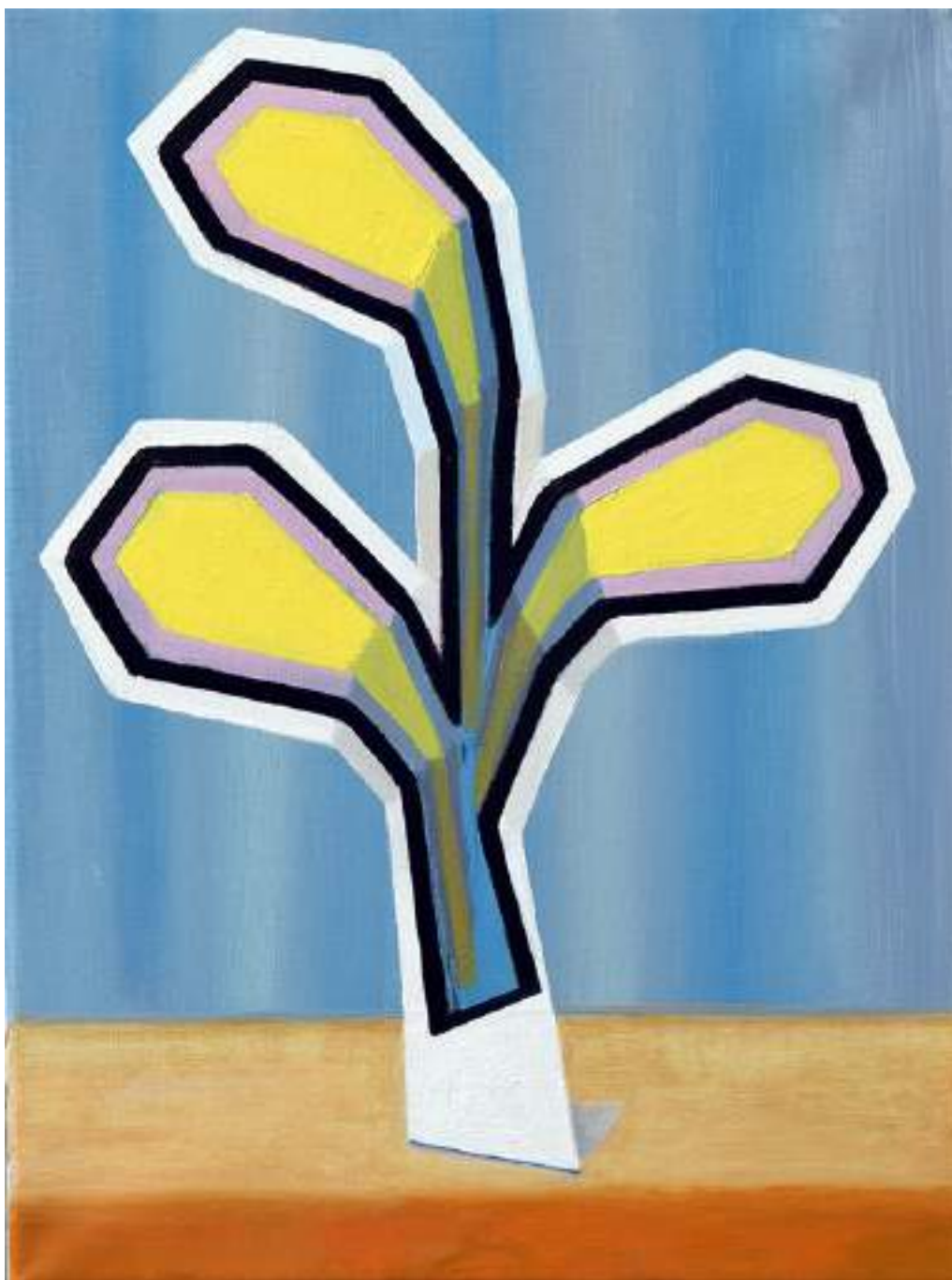
Still Life , 2017 Oil on canvas 40 x 30 cm