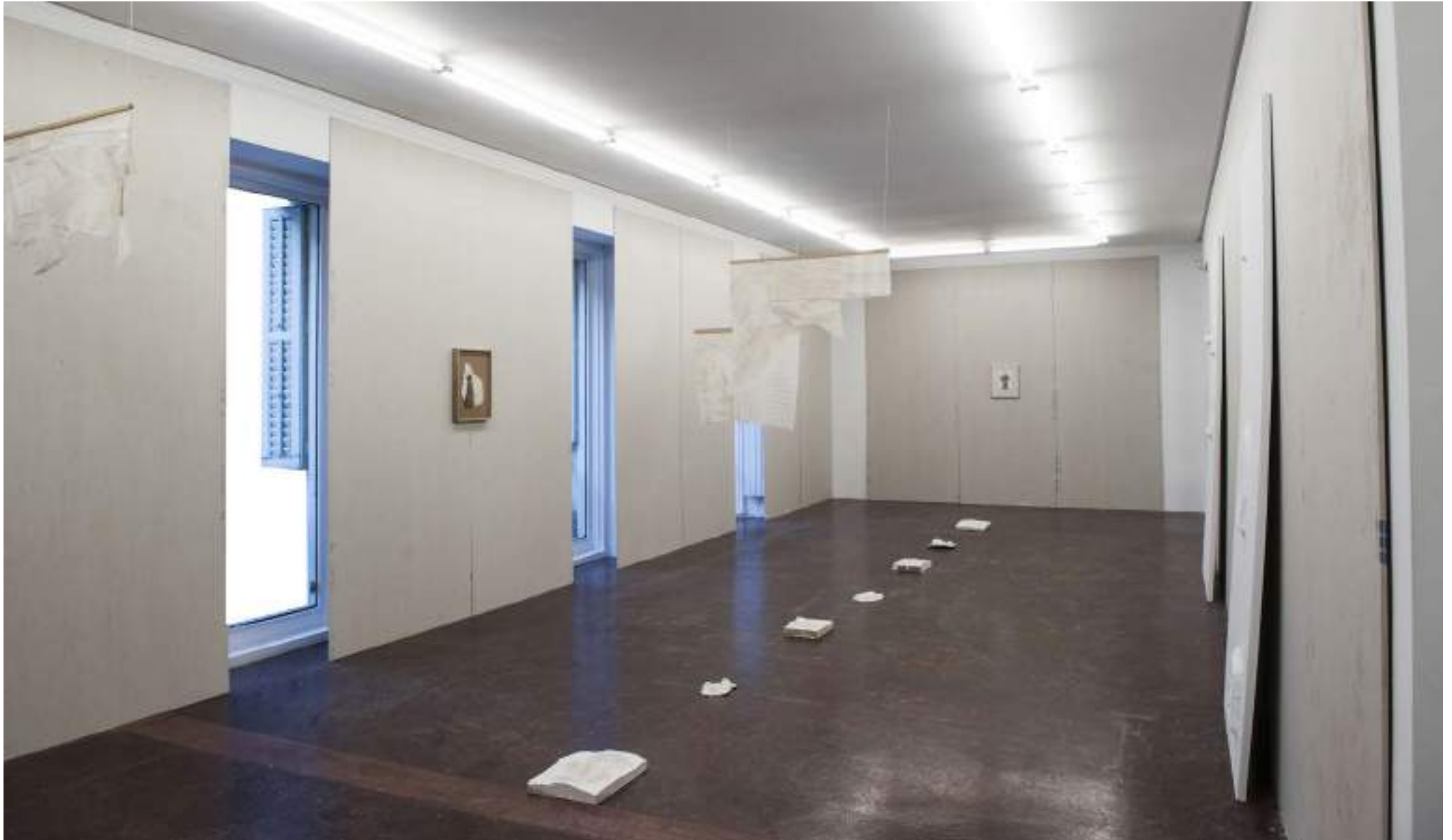
NF/ Interludio 4: Templo-Pladur. Clara Sánchez Sala 2021 Vista de instalación NF/ NIEVES FERNÁNDEZ, Madrid