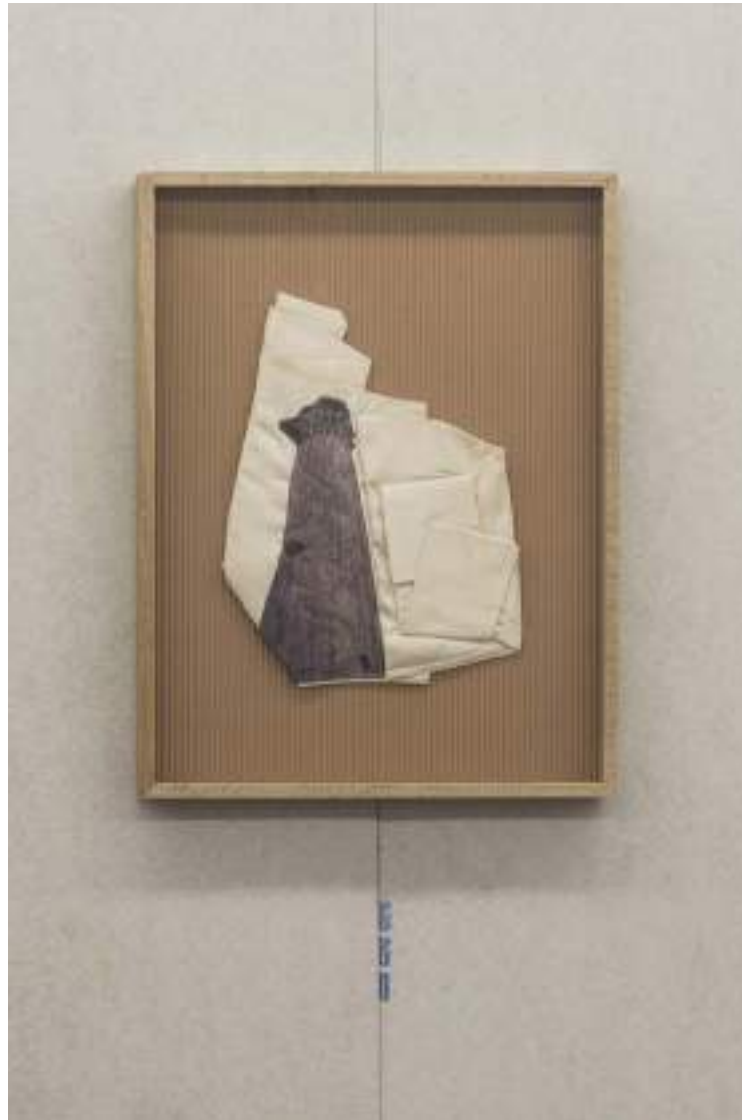
NF/ Clara Sánchez Sala Columna de manga larga 2021 Impresión textil sobre tela y cartón 46,5 x 36,5 cm