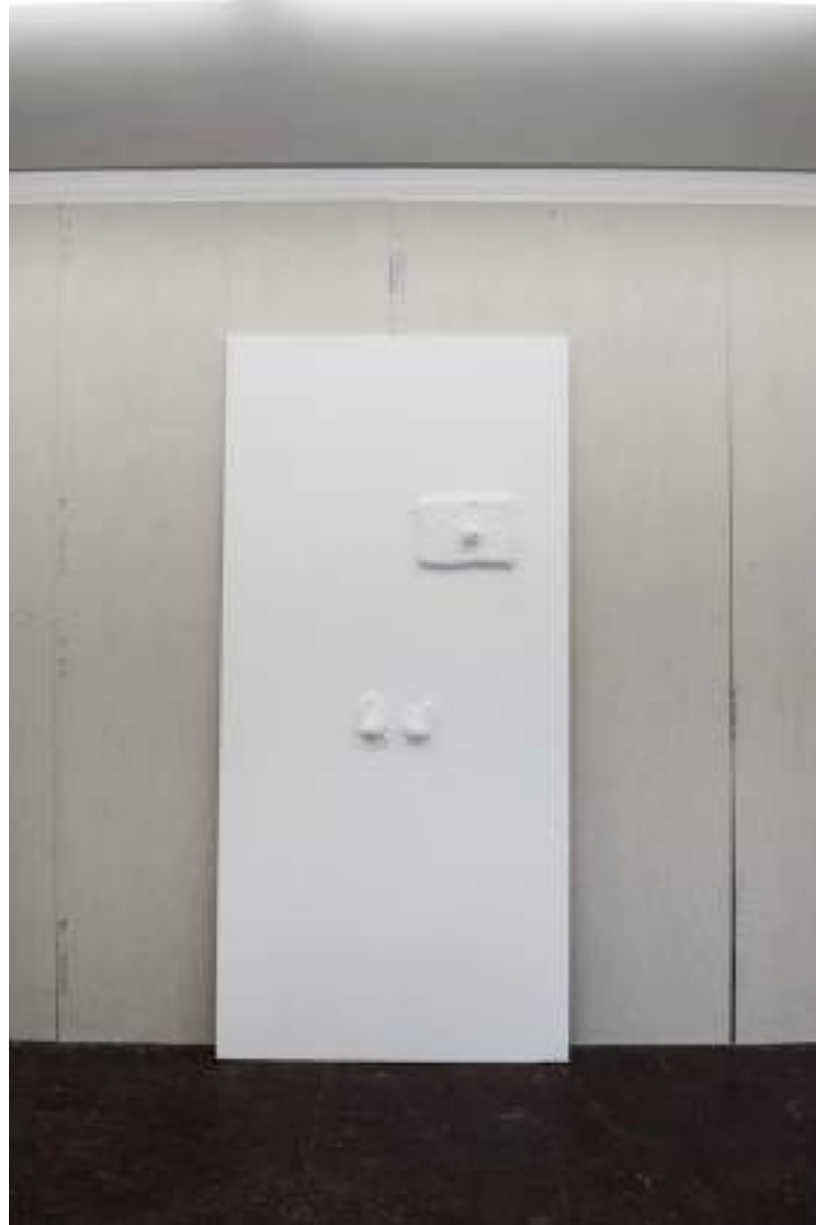
NF/ Clara Sánchez Sala Templo-Pladur II 2021 Escayola 250 x 120 cm