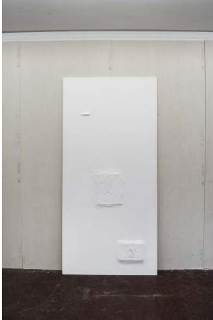
NF/ Clara Sánchez Sala Templo-Pladur I 2021 Escayola 250 x 120 cm