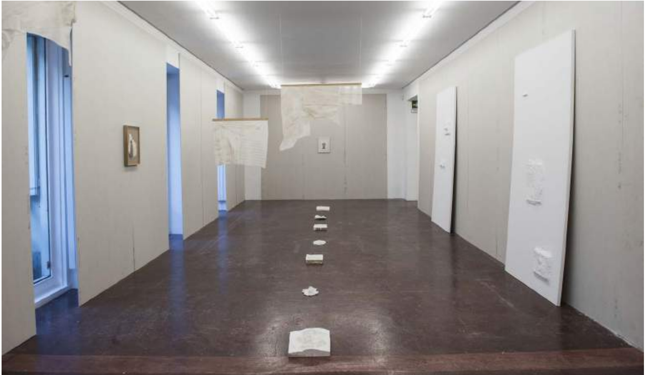
NF/ Interludio 4: Templo-Pladur. Clara Sánchez Sala 2021 Vista de instalación NF/ NIEVES FERNÁNDEZ, Madrid