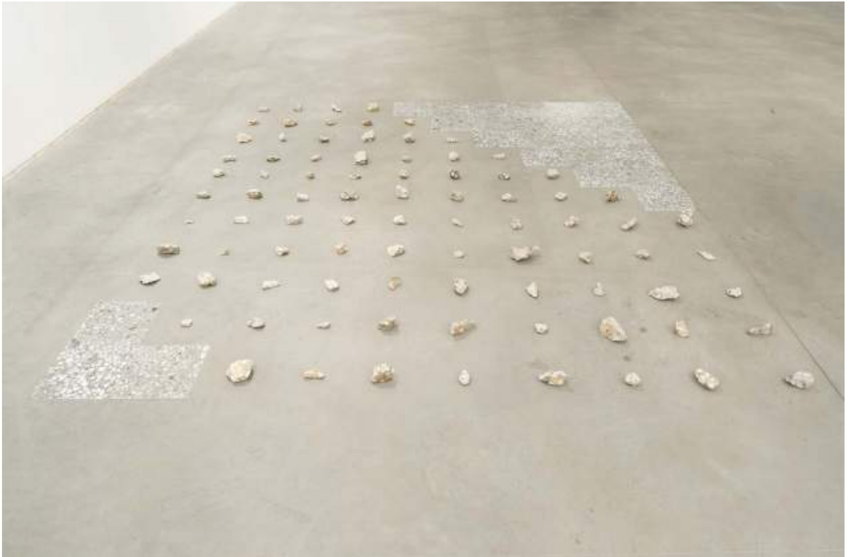
NF/ Clara Sánchez Sala L'espace critique 2019 Piedras, metacrilato y pintura acrílica 300 x 600 cm, 18 m 2