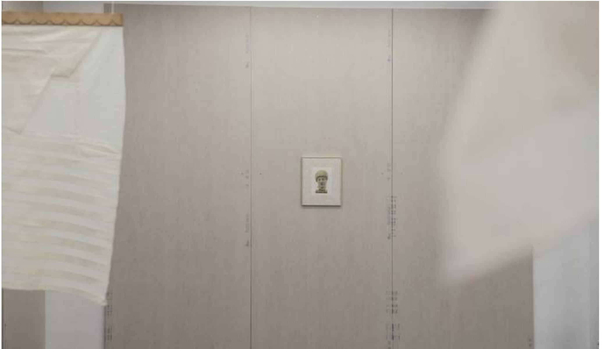
NF/ Interludio 4: Templo-Pladur. Clara Sánchez Sala 2021 Vista de instalación NF/ NIEVES FERNÁNDEZ, Madrid