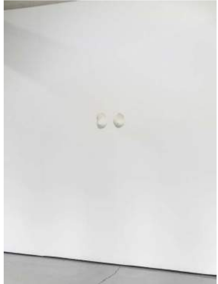
NF/ Clara Sánchez Sala Pot Life 2021 Jabón 14 x 10 x 5 cm