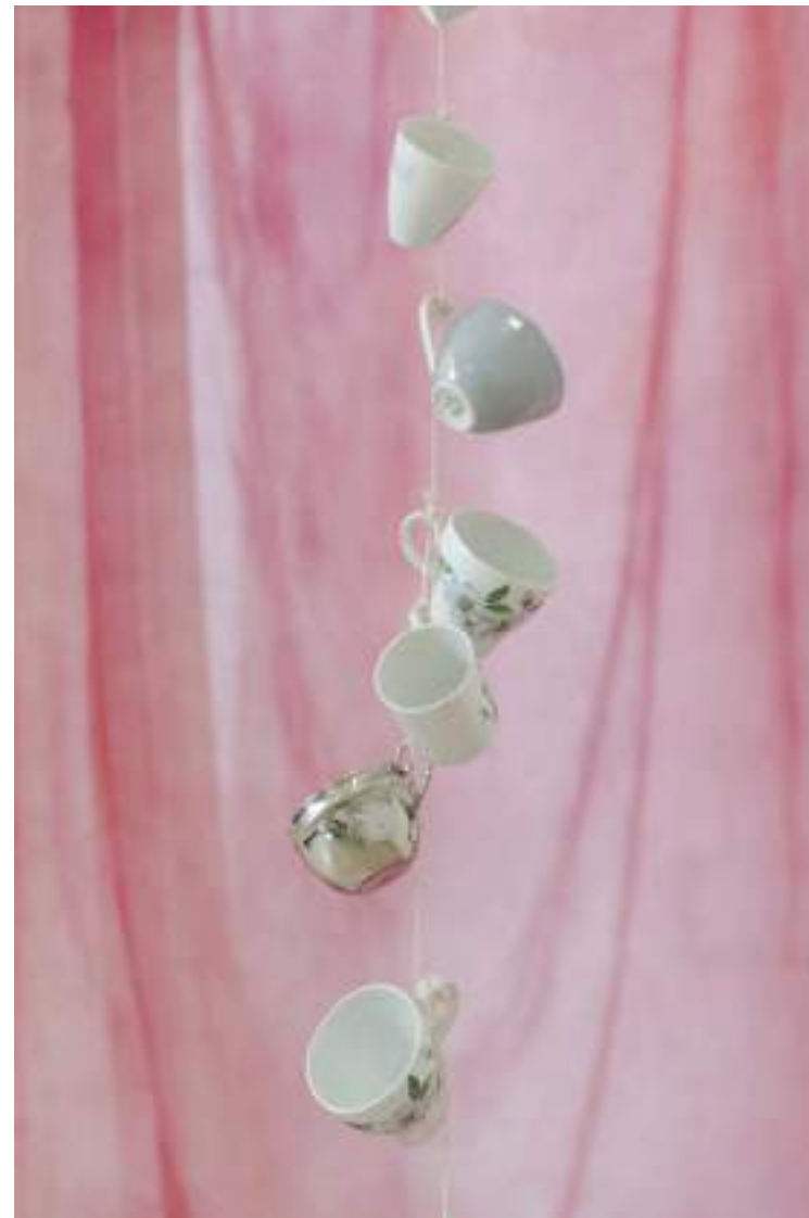
NF/ Clara Sánchez Sala C/ Argmosa 39 2021 Tazas, cordel y telas teñidas con café y pintalabios Medidas variables