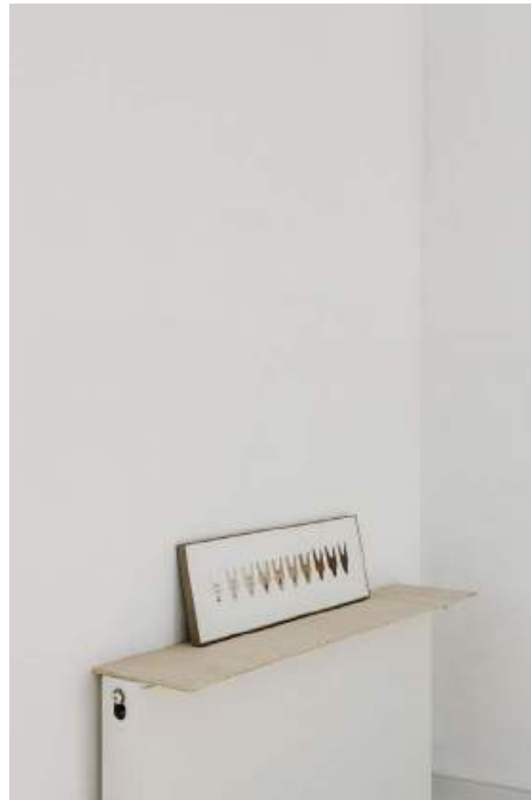
NF/ Clara Sánchez Sala Formas de narrar la espera 2017 Tickets de espera y café 30 x 90 cm