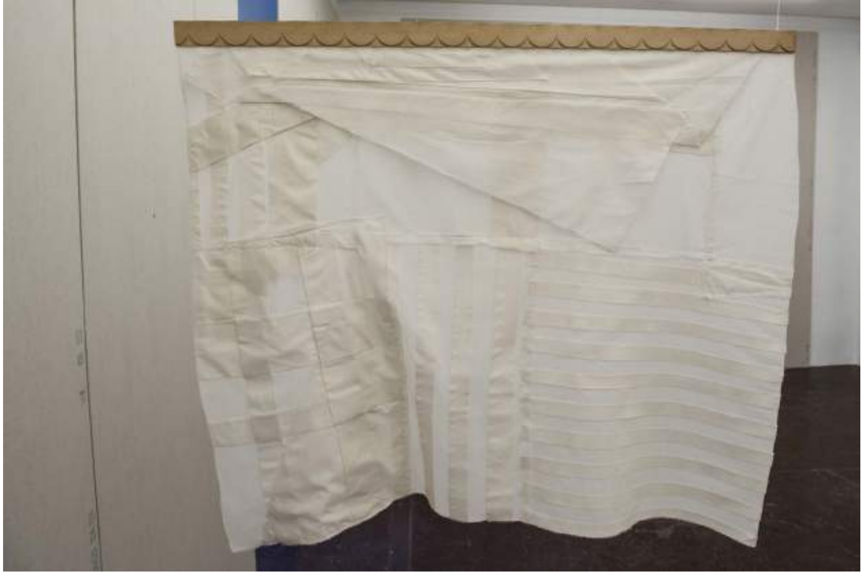
NF/ Clara Sánchez Sala Korai III 2021 Tela, madera y metal 91 x 100 cm