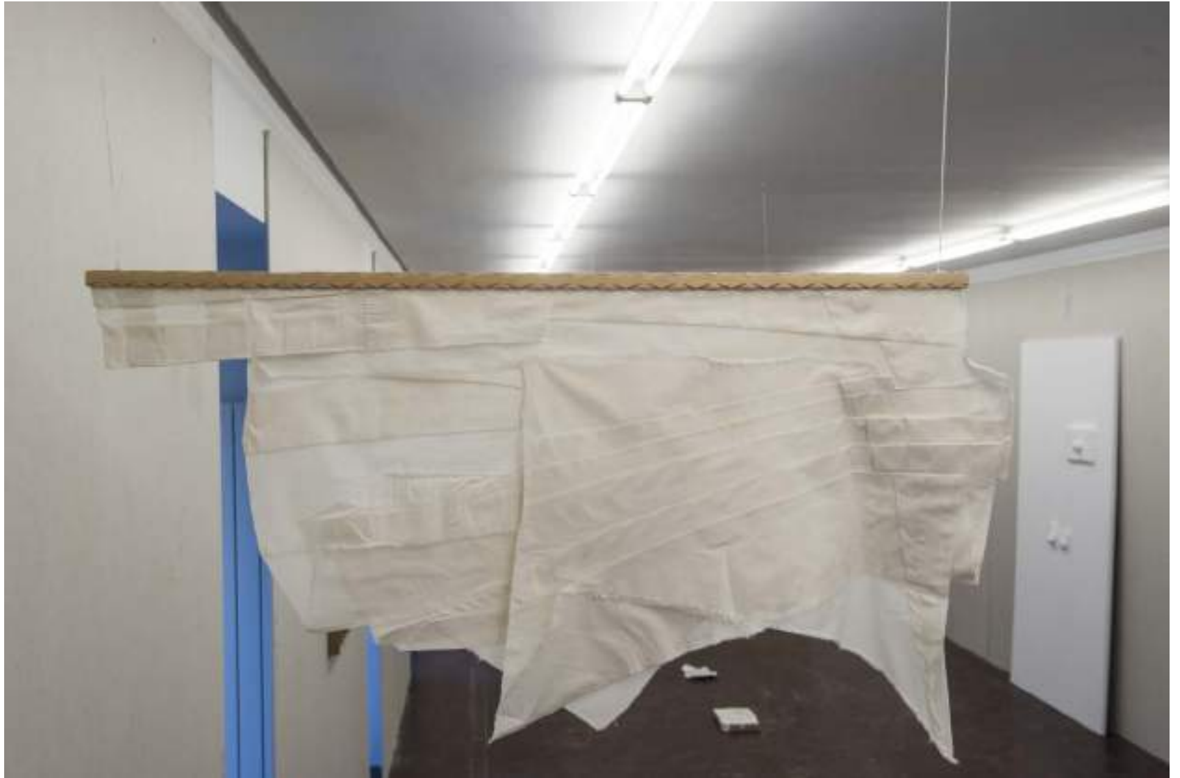
NF/ Clara Sánchez Sala Korai I 2021 Tela, madera y metal 57 x 100 cm