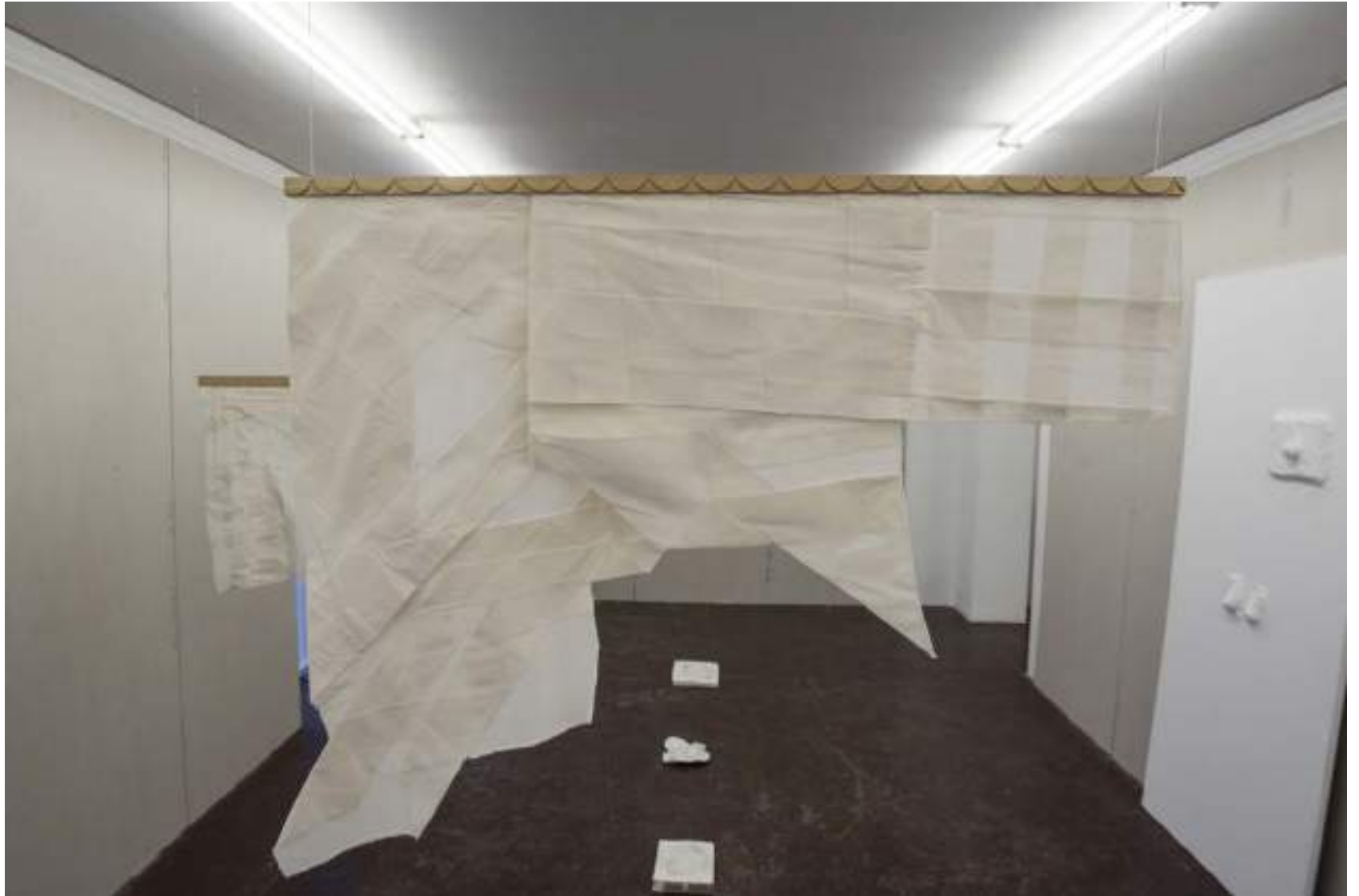
NF/ Clara Sánchez Sala Korai II 2021 Tela, madera y metal 83 x 100 cm