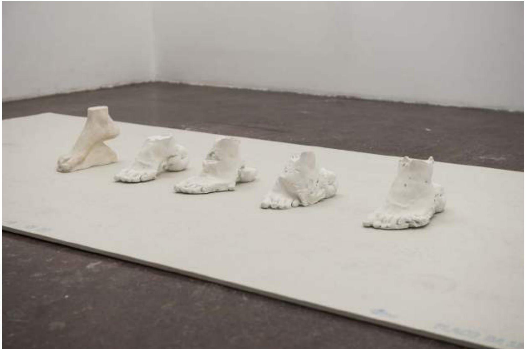
NF / Clara Sánchez Sala Módulo para levantar columnas 2021 Escayola Medidas variables