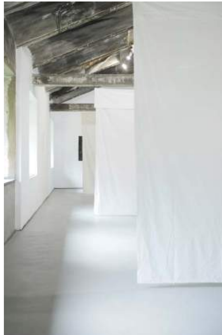
NF/ Clara Sánchez Sala Pot Life 2021 Sábanas y canas del cabello de la artista 170 x 270 cm c/u