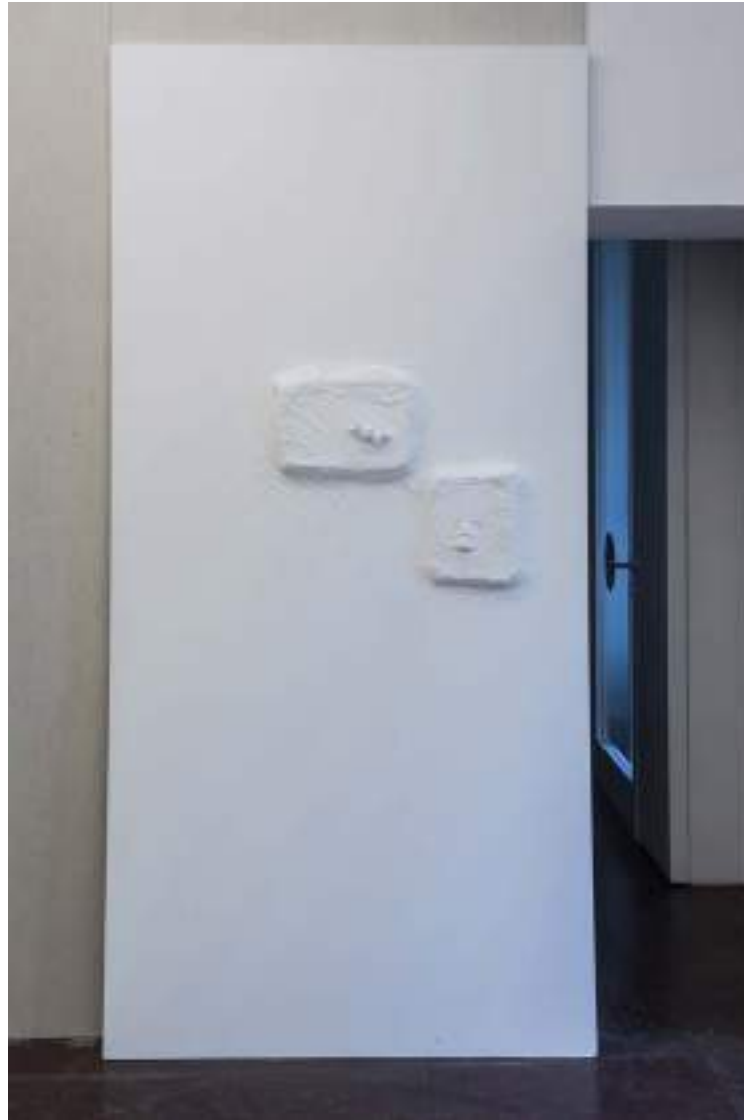
NF/ Clara Sánchez Sala Templo-Pladur III 2021 Escayola 250 x 120 cm